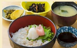
釜揚げしらす丼 700円

遊具やおさかな館、温浴施設と充実した施設が魅力で、1日楽しめる評判の道の駅。週末には、多くの子ども連れファミリーも訪れる。