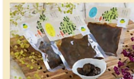
しいたけ三宝 各380円

地域交流の場として「こども食堂」の食事も提供している。名産のそばをはじめ、豊後高田市の土産品も充実している直売所。