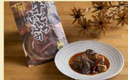
おおいた豊後牛 牛とろ煮込み 1,300円

カボスをはじめ、地元食材を加工したオリジナル商品も多く展開している。テイクアウトできる豊後牛メンチカツやコロッケは好評。