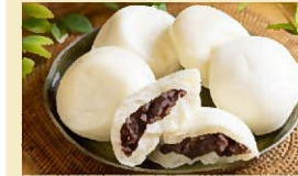
酒まんじゅう(5個入り) 540円

地元の新鮮な食材はもちろん、幅広くオリジナル加工品も展開する直売所。モモや金ごまのソフトクリームはファンが通うほどの人気ぶり。