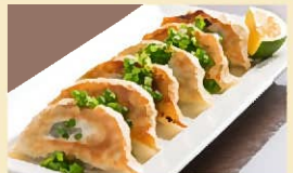
武蔵ネギ餃子 定食700円・単品550円・テイクアウト400円

地元の農作物以外に、直営農場では有機農業にも取り組んでいる。野菜や加工品も販売。食堂では県産食材を生かしたメニューを提供。