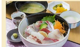
海の彩り海鮮丼 1,490円

東九州道「蒲江インター」から800mという立ち寄りやすい立地。蒲江産の魚介類をメインに佐伯の特産品を多く取り扱う。