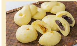
すごあまコーンまんじゅう 237~388円

祖母・阿蘇、くじゅう連山に囲まれた絶景の地に位置する。昼夜の寒暖差のある高冷地を生かして栽培された高原野菜が多数揃う。