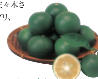
大分の食卓に欠かせないカボスは、料理も素材そのものの味も引き立てる。

水揚げされた「かぼすブリ」は全身の色つやも美しく、ずっしりとした手ごたえから引き締まった肉質が伝わってきます。さばく時に実感するのが脂の質で、一般的な養殖ブリに比べて包丁の感触がとても軽いことに驚きます。つまり、脂がしつこくなくさっぱりしている証で、ブリの刺身が苦手な人でもおいしく食べられたという感想も寄せられているほど。「さっぱりと食べやすい、かぼすブリで今後はブリという魚のおいしさを広く味わってもらいたい」と佐々木さんは期待を寄せています。養殖ブリ、カボス共に大分県を代表する特産品のハイブリッド産品ともいえる「かぼすブリ」。第2の関あじ、関さばを目指して、生産者の挑戦は始まったばかりです。