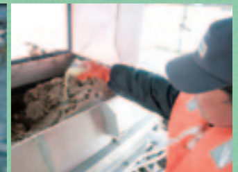
カボス果汁の液体と粉末の両方で試しながら、より効果的な方法を探っている。