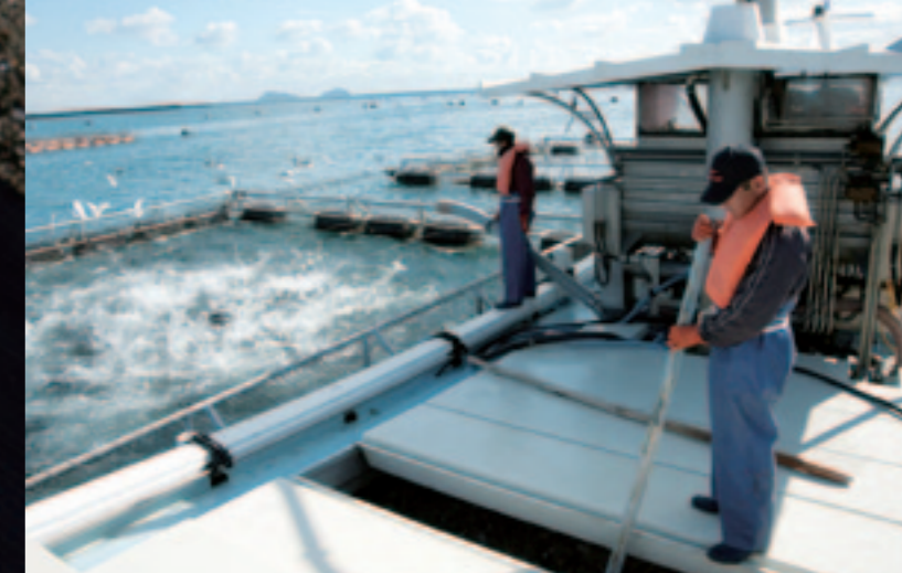
冷たい海風をものともせず、海と魚の状態をよく観察しながらの作業が続く。