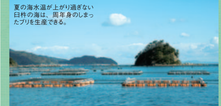
夏の海水温が上がり過ぎない臼杵の海は、周年身のしまったブリを生産できる。