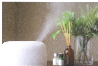
香りを楽しむかぼすの使用事例