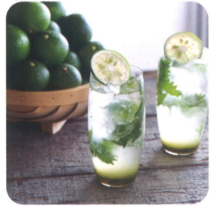
※料理の画像はイメージです。今回のイベントとは関係ありません。

大分かぼすを使ったオリジナルメニューの作り方を大公開。 ステージの上で実際に調理をしながら、わかりやすく教えてください。